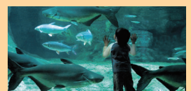
アクア・トトぎふ

休業日:無休(ただし臨時休業あり)、料金:大人1,500円、中・高校生1,100円