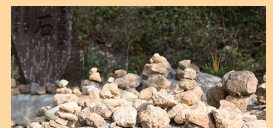
尾張富士浅間神社

ご鎮座は昭和5年。桃太郎神社の位置する木曾川河畔に桃太郎誕生地伝説があり、鬼退治をした桃太郎は桃の実から現れた大神実命であると伝えられております。5月の桃太郎まつりは有名です。TEL(0568)61-1586