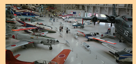
岐阜かかみがはら航空宇宙博物館