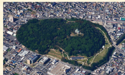
小牧山は尾張徳川家によって大切に保護され、保存状態が良好で今も遺構を見ることができます。