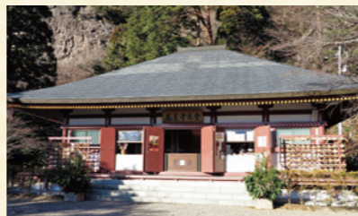
幼くして命を狙われていた虎松(後の直政)は8歳から14歳までを鳳来寺で過ごし、武将として必要な教養を僧侶たちから学びました。