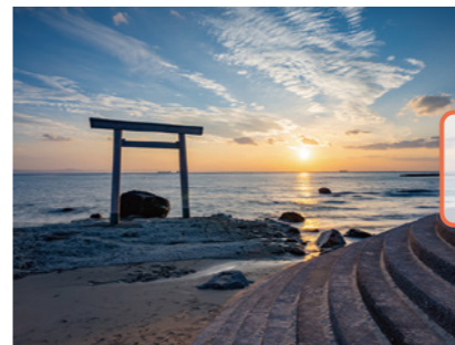
豊橋市八町通3-17 9:00~16:30 0532-52-5257