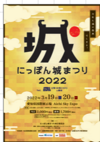
にっぽん城まつり

全国の様々なお城の情報や限定グッズが集まる「お城情報エリア」をはじめ、東海三県のグルメ・地酒の販売、お城のスペシャリストによるトークショー、武将隊による演武など、多くの方に楽しんでいただける内容となっています。是非御来場ください。